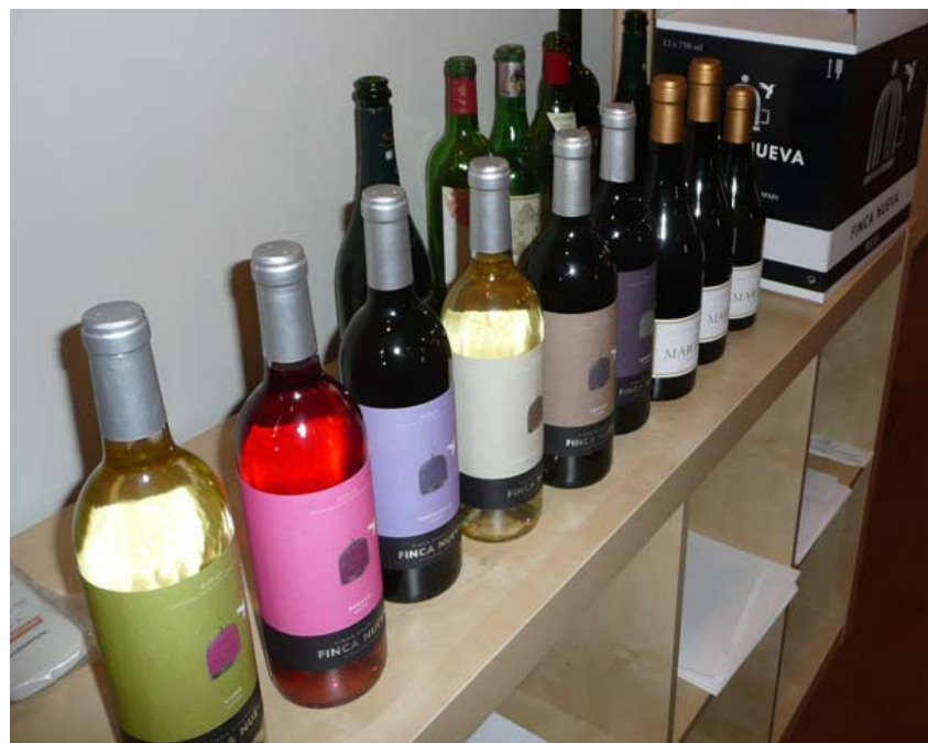
Vinos de Finca Nueva (D.O.C. Rioja), última bodega que ha abierto sus puertas en España